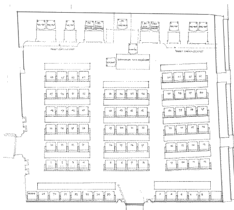
Place de travail